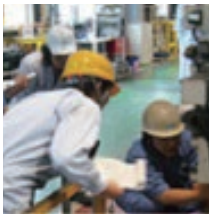
点検・ グリスアップ